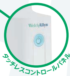
タッチレスコントロールパネル

AU-48810 GSイグザミネーションライトIV テーブル/ウォールマウント付