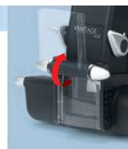
※Teaching ミラーとの併用はできません。