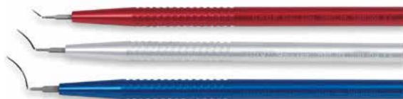
AU-2110 D.A.L.K. スパチュラセット 3本組