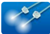
AU-3269PD27S ディスポ エッカード氏 ツインライトシャンデリア 27G(0.4mm)フォトン用6本入 承認番号:22300BZX00318000