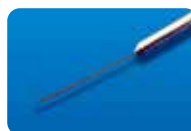
AU-1270-01 ディスポ インジェクションニードル 41G (0.1mm) 1本入