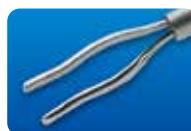
AU-2286I アフジ氏 異物鉗子 20G