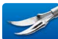
AU-1286MD-1/AU-1286MD-5 ディスポ マイクロ剪刀 水平 カーブ 20G (0.9mm) 1本入/5本入