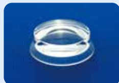
AU-1284FD ディスポ 拡大ビトレクトミーレンズ 5個入