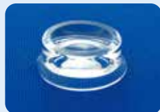
AU-1284ED ディスポ バイコンケーブ ビトレクトミーレンズ 5個入