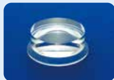
AU-1284DD ディスポ フラット ビトレクトミーレンズ 5個入