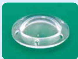
AU-1285-1 / AU-1285-2 / AU-1285-5 エッカード氏 角膜プロテーゼ (一時的人工角膜)