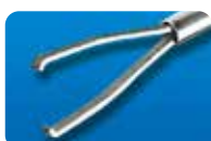
AU-1286ILMD-1/AU-1286ILMD-S ディスポ ILM 鉗子 20G (0.9mm) 1本入/5本入