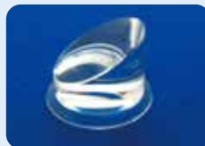
AU-1284ID ディスポ 30°プリズム ビトレクトミーレンズ 5個入