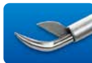
AU-1286ED-1/AU-1286ED-5 ディスポ マイクロ剪刀 垂直 20G (0.9mm) 1本入/5本入