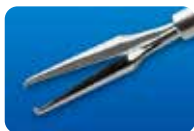
AU-1286WD-1/ AU-1286WD-5 ディスポ エッカード氏 ILM 鉗子 20G (0.9mm) 1本入/5本入