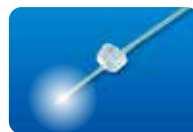
AU-3269P27S ディスポ ワンポートシャンデリア 27G(0.4mm)フォトン用6本入 承認番号:22300BZX00318000