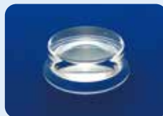
AU-1284GD ディスポ ワイドフィールド ビトレクトミーレンズ 5個入