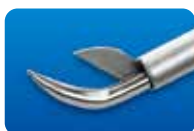
AU-1286E マイクロ剪刀 垂直