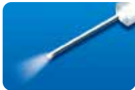
AU-3269D-6 ディスポ ファイバークローブ 20G(0.9mm)6本入