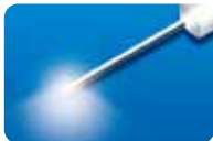
AU-3269SBS-6 ディスポ トータルビュー ファイバークローブ シールド付 20G(0.9mm)6本入