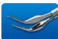
AU-1286O サブレチナル用鉗子 水平 60° アングル 3.0mm