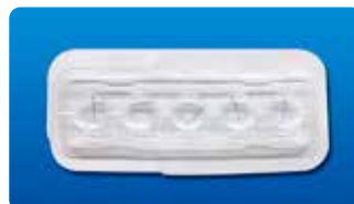
AU-4020 ディスポ アイリスレトラクター 5個入