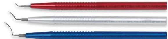
AU-2110 D.A.L.K. スパチュラセット 3本組