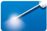
AU-3269SBS-6 ディスポ トータルビュー ファイバープローブ シールド付 20G (0.9mm) 6本入