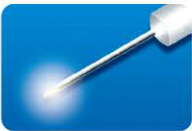
AU-3269B-6 ディスポ トータルビュー ファイバープローブ 20G (0.9mm) 6本入