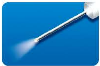
AU-3269D-6 ディスポ ファイバープローブ 20G (0.9mm) 6本入