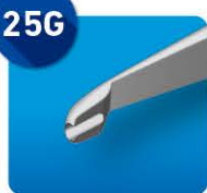
AU-1286-SFD ディスポ シャリオ氏 IOL 固定用鉗子 25G 直 / 曲