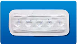
AU-4020 ディスポ アイリスレトラクター 5個入