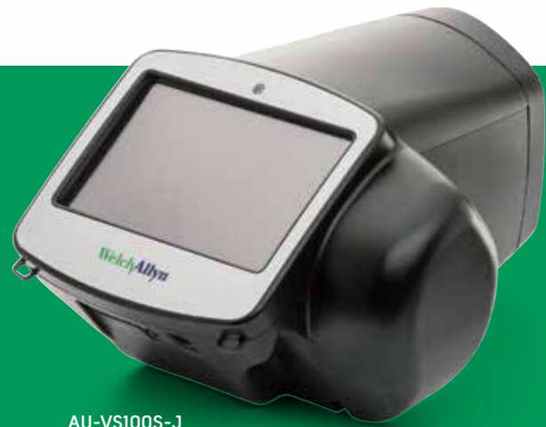
AU-VS100S-J スポットビジョンスクリーナー(キャリーケース付)

日本では3歳児健診で、問診やランドルト環などによる目のスクリーニングが実施されておりますが、その方法は自治体によってさまざまであるのが現状です。