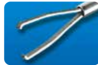
AU-1286ILMD-1/AU-1286ILMD-S ディスポ ILM 鉗子 20G(0.9mm) 1本入/5本入