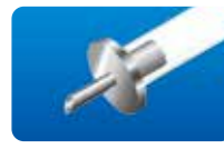
AU-1272GD-5 コロベルニック氏 セルフリテイニング インフュージョンカニューレ (4.0mm)5本入