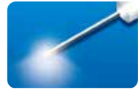
AU-3269SBS-6 ディスポ トータルビュー ファイバープローブ シールド付 20G(0.9mm)6本入