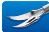
AU-1286M マイクロ剪刀 水平 カーブ