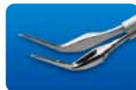
AU-1286O サプレチナル用鉗子 水平 60° アングル 3.0mm