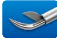
AU-1286ED-1/AU-1286ED-5 ディスポ マイクロ剪刀 垂直 20G(0.9mm) 1本入/5本入