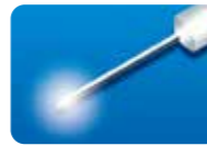
AU-3269B-6 ディスポ トータルビュー ファイバープローブ 20G(0.9mm)6本入