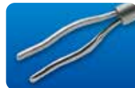
AU-2286I アフジ氏 異物鉗子 20G