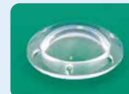
AU-1285-1 / AU-1285-2 / AU-1285-5 エッカード氏 角膜プロテーゼ (一時的人工角膜)