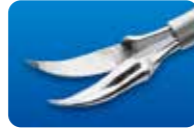
AU-1286MD-1/AU-1286MD-5 ディスポ マイクロ剪刀 水平 カーブ 20G(0.9mm) 1本入/5本入