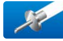
AU-1272FD-5 コロベルニック氏 セルフリテイニング インフュージョンカニューレ (5.0mm)5本入