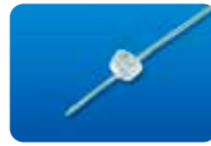
AU-3269P27S ディスポ ワンポートシャンデリア 27G(0.4mm)フォトン用 6本入