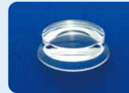
AU-1284FD ディスポ 拡大ビトレクトミーレンズ 5個入