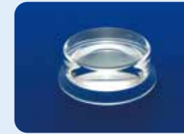
AU-1284GD ディスポ ワイドフィールド ビトレクトミーレンズ 5個入