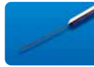
AU-1270-01 ディスポ インジェクションニードル 41G(0.1mm)1本入