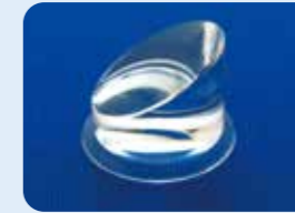
AU-1284ID ディスポ 30°プリズム ビトレクトミーレンズ 5個入