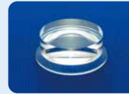
AU-1284DD ディスポ フラット ビトレクトミーレンズ 5個入