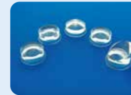
AU-1284DIS ディスポ ビトレクトミーレンズセット (1284DD/ED/FD/GD/ID 各1個)