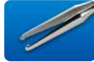
AU-1286BD-1/AU-1286BD-5 ディスポ マイクロ鉗子(エンドグリップ) 20G(0.9mm) 1本入/5本入