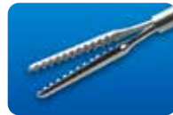
AU-1286CD-1/AU-1286CD-5 ディスポ マイクロ鉗子(グリップタイプ) 20G(0.9mm) 1本入/5本入