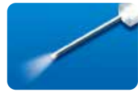
AU-3269D-6 ディスポ ファイバープローブ 20G(0.9mm)6本入