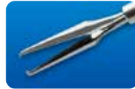
AU-1286WD-1/ AU-1286WD-5 ディスポ エッカード氏 ILM 鉗子 20G(0.9mm) 1本入/5本入