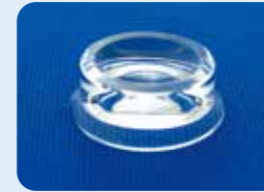
AU-1284ED ディスポ バイコンケーブ ビトレクトミーレンズ 5個入